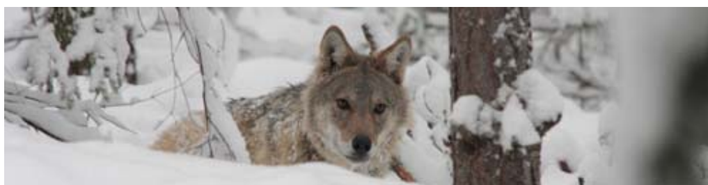
Hanvalp från Galven-reviret. Bilden tagen i samband med märkningen i början av december.